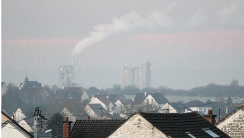
07/12/2016 Cimenterie Calcia Gargenville HeidelbergCement Group Pic de pollution - 2 ème jour de circulation alternée